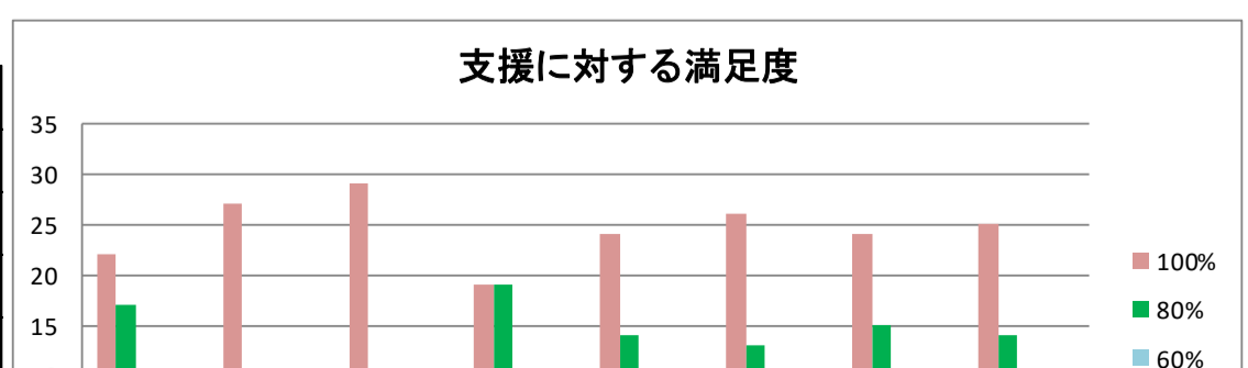
支援に対する満足度